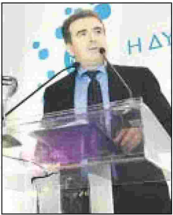
Μ. Χρυσοχοϊδης: Οι υψηλές εργοδοτικές εισφορές και το ασταθές φορολογικό περιβάλλον πλήττουν την ανταγωνιστικότητα. Οι πόροι του ΕΣΠΑ δεν φτάνουν στην πραγματική οικονομία

ΜΕ ιδιαίτερη επιτυχία και την καταγραφή της ως μιας τιμητικής αναγνώρισης της επιτυχημένης δράσης των βορειοελλαδικών επιχειρήσεων που μέσα σε ένα δυσμενές οικονομικό κλίμα και σε περιβάλλον παγκόσμιας ύφεσης κατάφεραν να εισφέρουν θετικά στην ανάπτυξη της περιοχής, πραγματοποιήθηκε την Παρασκευή 20 Ιανουαρίου 2012 η 1η τελετή βράβευσης μεταποιητικών επιχειρήσεων της Βόρειας Ελλάδας με τίτλο: ΕΛΛΗΝΙΚΗ ΑΞΙΑ.